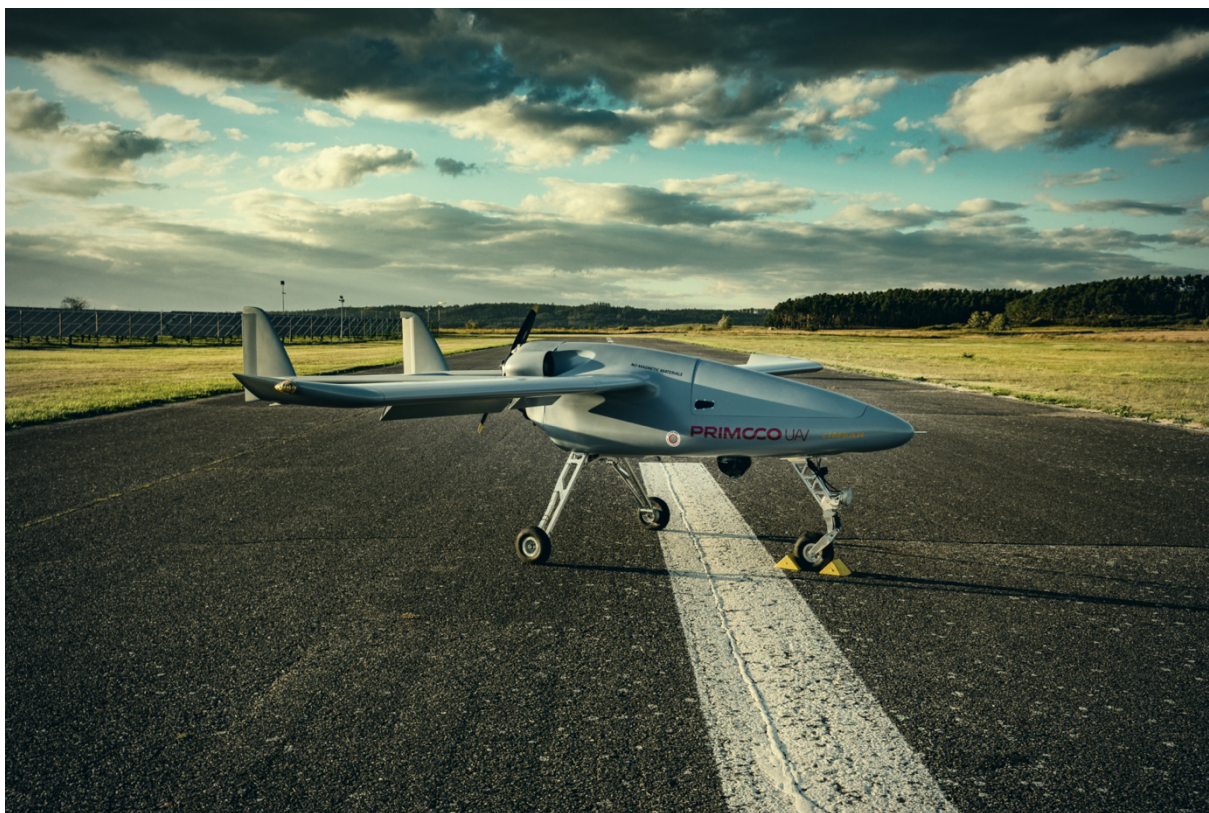
UAV Primoco One 150

Model One 150 využívá motor Primoco Engine 340, který vyvinul a vyrobil Emitent. Jedná se o nový čtyřtákní spalovací motor a oproti předchozím dvoutákním motorům Primoco Engine 500 představuje významné zlepšení z hlediska hospodárnosti, výkonu a hlučnosti. Motor Primoco Engine 340 lze prodávat též samostatně a využívat jej pro jiné typy letounů.